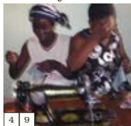
4 | 9 Pag-La Yiri