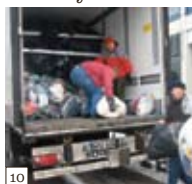
10 Puolan rekka