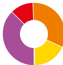
FÖRDELNING AV KOSTNADERNA 2016