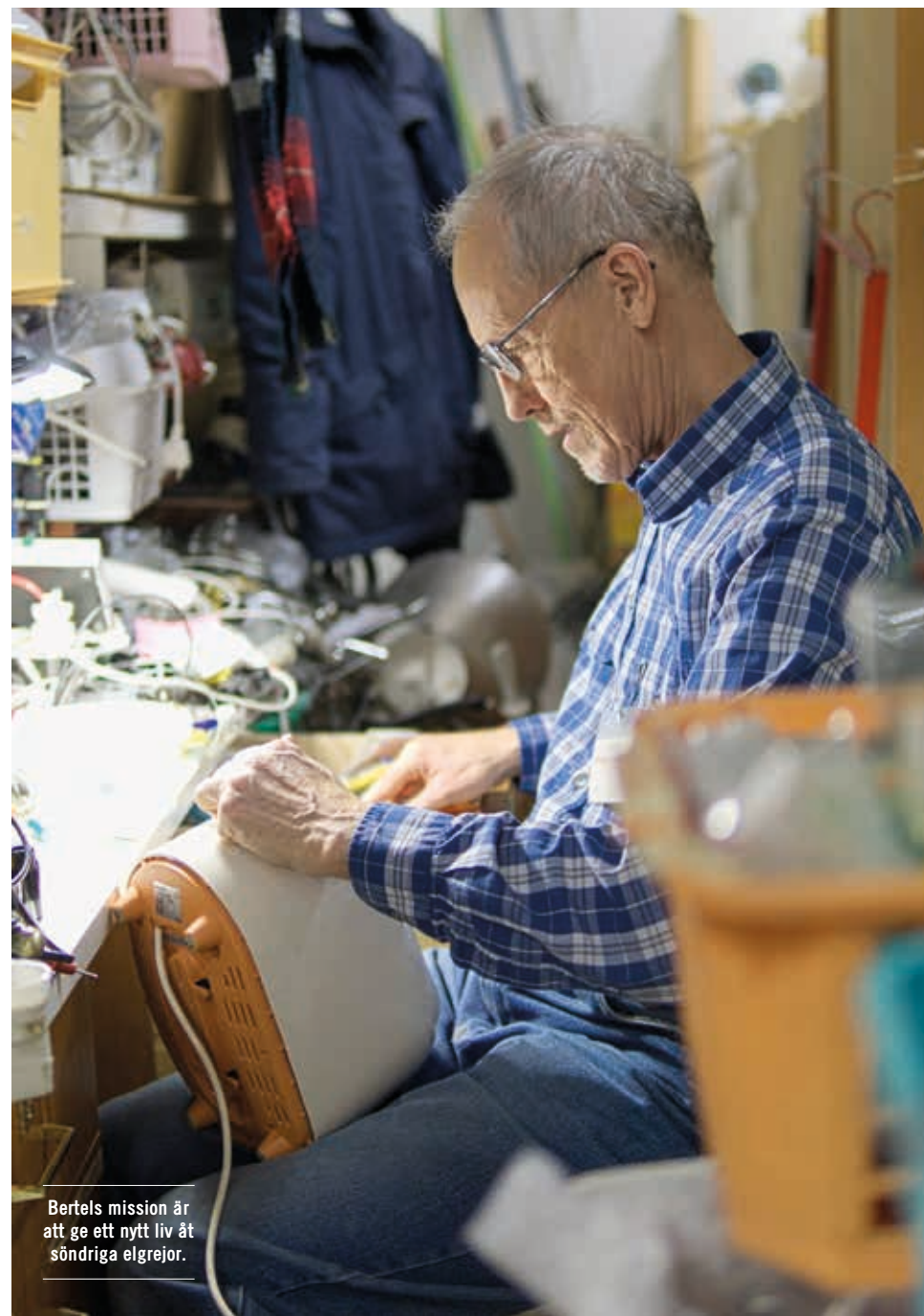
Bertels mission är att ge ett nytt liv åt söndriga elgrejor.

TEXT SANNI HANBLI | ÖVERSÄTTNING: POLA STENBERG