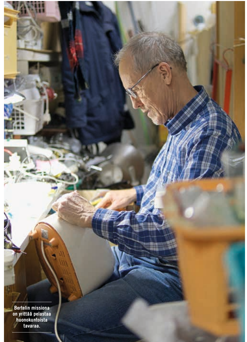
Bertelin missiona on yrittää pelastaa huonokuntoista tavaraa.