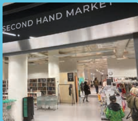
↑ Emmauksen myyntipiste Redissä.